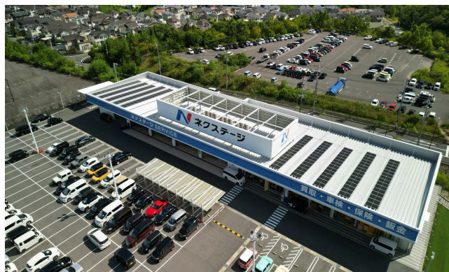
株式会社ネクステージ 土岐多治見店